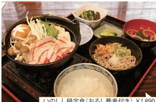
いのしし鍋定食(おろし蕎麦付き) ¥1,890

いっけい! 豚と土の中で生まれ育ち おかげでいっけい! 舌が肥えている。 きょうも情熱的! 又集う道をたどり進むもぐら!