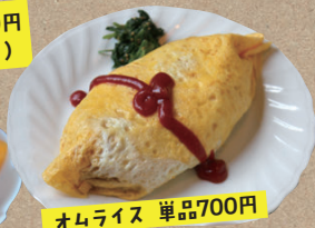
オムライス 単品700円

優しい味わいの中に、トマトの酸味が効いている、昔ながらのシンプルなオムライス。玉子とライスのバランスも絶妙♪町内外のリピーターも多い、人気メニュー。