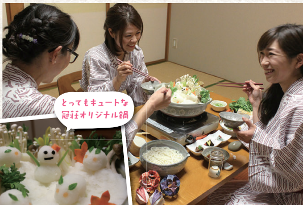
とってもキュートな冠荘オリジナル鍋

池田町の新鮮野菜&越前旨香豚がたっぷり入ったお鍋。いけだのあま〜い大根おろしをかけた、冬だけの雪鍋。大根おろしは、美肌やダイエット効果だけでなく、「医者いらず」と言われるほど!雪景色に見とれながら、池田食&美人の湯(温泉)で、「乙女タイム」をお楽しみ♪