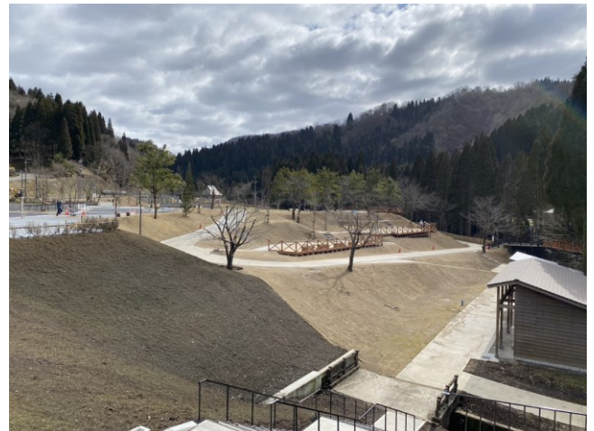
敷地内にはウッドデッキやベンチが点在