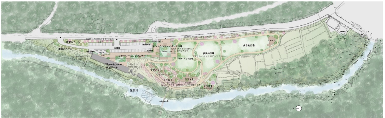
国道 417 号線沿い、かずら橋から約 600m 下流に位置