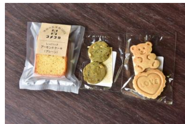
子どもたちへのお土産に地元のお菓子