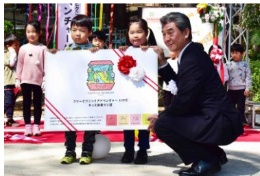
子どもたちへキッズ営業マン証の授与