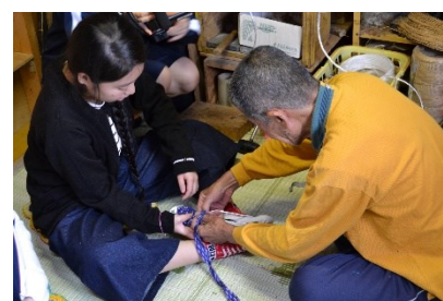
池田のおじいちゃんとの布わらじづくり