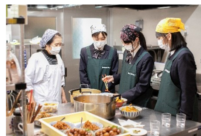
池田町郷土料理の調理体験