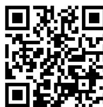
ふるラボ申し込みページ