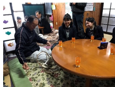
農家の「かんじき作り」

福井県池田町と芝商業高校との取り組みは、2014年から始まり、今年で10年目を迎えます。人々との関わりの中で生徒たちが主体的、共同的に課題を発見し、解決することを目的としたアクティブラーニングを実践してきました。その中で、今年度から「いけだ部」および「芝商いけだ部 応援プロジェクト型ふるさと納税」がスタート。新たに発足した「いけだ部」を応援・支援する、他にはない形のふるさと納税が誕生しました。納税でいただいた寄付金をもとに、福井県池田町と芝商業高校は今後も継続的に交流事業を展開していく予定です。