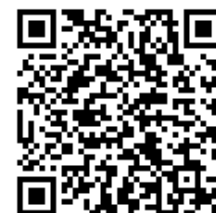
福井県池田町紹介動画