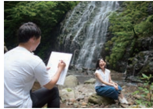
ゆっくりとした時間を過ごそう

写真家や画家も愛し てやまない渓谷美は、 四季折々で表情を変え 楽しませてくれます。 清々しい夏の朝、ス ケッチブック片手に訪 れてみよう。