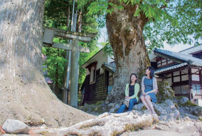
5 寄り添う巨木がお出迎えしてくれる白山神社