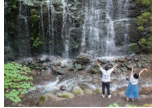
滝つぼのすぐ近くでおもいきり深呼吸

木々からこぼれる光の アーチをどんどんくぐり 抜け、部子川の上流へと 車を走らせると、龍双ヶ 滝に辿り着きます。