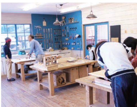
10 大人も子供も一日夢中で楽しめる木工体験工房♪