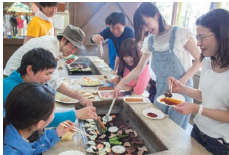
6 備品レンタルOKのバーベキュー。選べる食コースも!