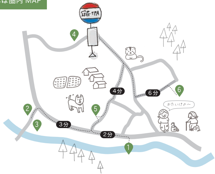
6 木の上でゆったり遊べるピクニックコースはカメラ持込OK! #池田でおしゃピクでSNS投稿してみてね♪ 春夏秋冬遊バスのきっぷ提示で割引有! 施設体験料 20%OFF ※要予約

江戸しおりさん目線の 池田町情報が盛りだくさん! お店のかわいい情報も ディアふくいをチェックしてみてね♪