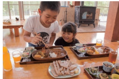
13 カラダに優しい&おいしいキッズメニューも!