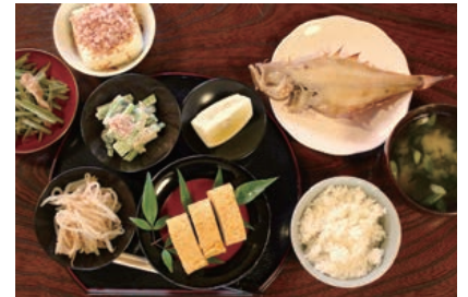
12 朝食には池田町の美味しいお米と卵焼きなど