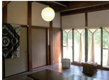
12 女性でも安心して泊まれるよう工夫

<料金 1名様 税込> 素泊まり 3,800円 夕食 1,300円 (19:30～) 朝食 900円 (7:30～) 温泉 500円