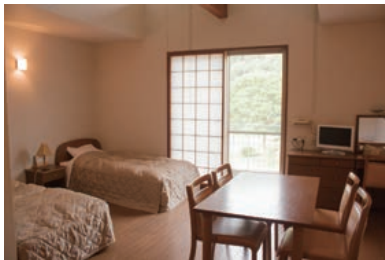
13 洋室デラックスツインのお部屋