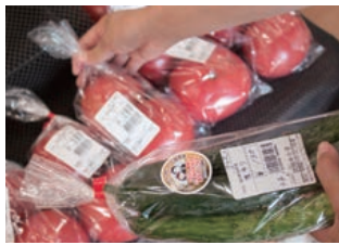
池田町の厳しい審査に合格した有機野菜

まちの駅こつてコテ いけだで、池田町産の 夏野菜を調達。カフェ モクモク駐車場に車を 停め、足羽川遊歩道に