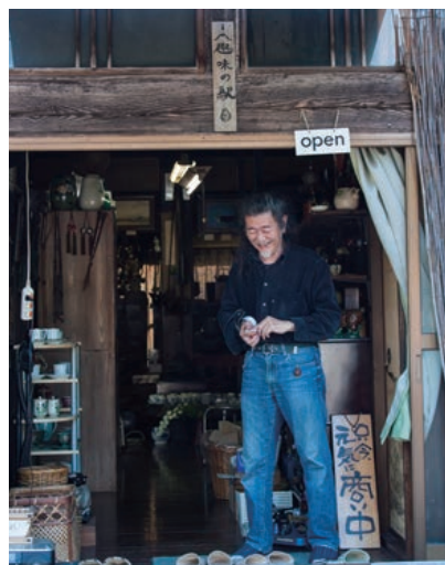
2 能面美術館は珍しい骨董品もたくさん