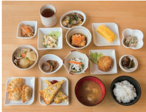
8 こってコテいけだ内にある地元食材を活かした食堂♪