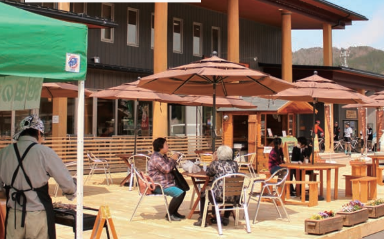
7 まちのみんなが腕ふるうマルシェには笑顔がいっぱい！

ikedanousonkanko1.wixsite.com/ikedamarche