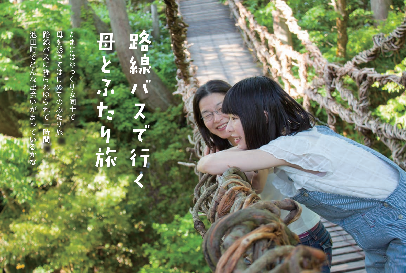
1 本州唯一のかずら橋。橋の中央から足羽川を見下ろすと…素敵な光景が！

たまにはゆっくり女同士で 母を誘ってはじめてのふたり旅 路線バスに揺られゆられて一時間 池田町でどんな出会いがまっているかな