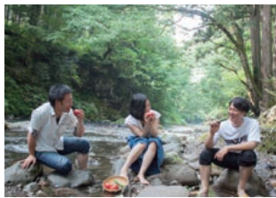
丹精込めて育てた野菜本来の味を楽しんで

下りてみよう。 浅瀬で野菜を冷やせ ば水の冷たさに思わず 嬉しくなります。五感 が研ぎ澄まされる自然 の涼を感じてみて。 *川は自然のものです 石の上も滑りやすいので くれぐれも気をつけてね