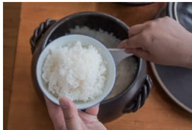
13 土鍋で炊いたご飯は忘れられないうまさ!