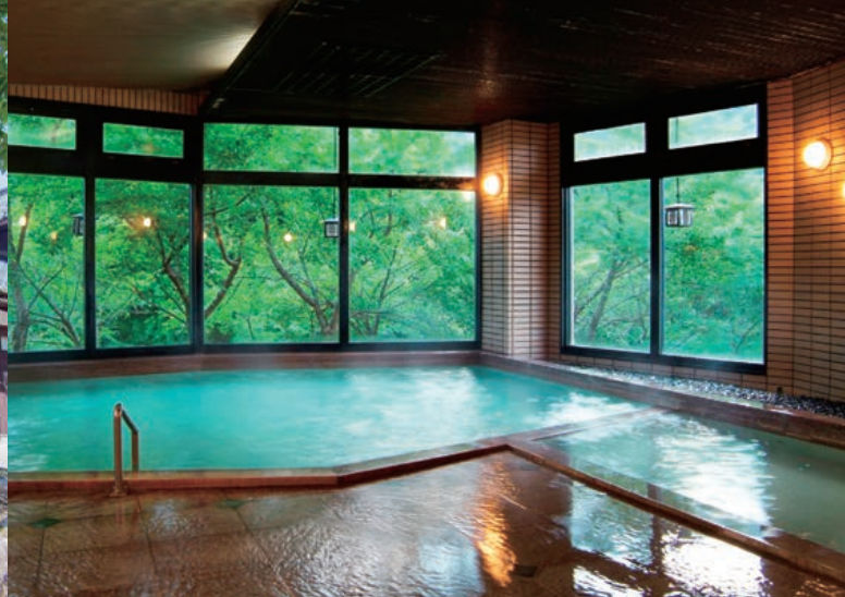
4 溪流温泉 冠荘。日帰り入浴は 通常大人 500円、小学生 300円、3歳以上 200円 春夏秋冬遊バスのきっぷ提示で割引有! 大人 400円、小学生 150円、3歳以上 150円