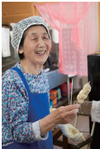
3 めくもり茶屋でアツアツ絶品きび団子

東京駅から電車で約四時間、JR武生駅から路線バスで約一時間。車窓は、商店街から田園風景へと移り変わり、緑生い茂る山道へ…この先本当に町があるのか不安になるころ、池田町に到着します。終点の、冠荘・ツリーピクニックアドベンチャーいけだで降車。すっごい田舎、空気がおいしい！「ようこそ」池田町の人はそう言って出迎えてくれました。帰り際にももう一度「ようこそ」。こんな遠いところまでよく来てくれましたね、またいつか顔を見せに来てね。心こもった言葉にほっこり。