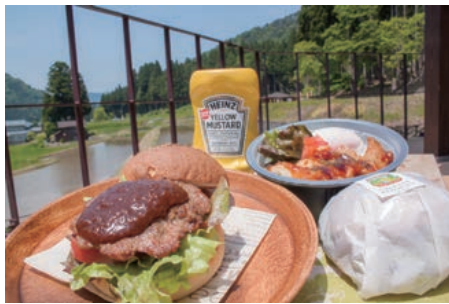
6 TPA内の Cafe Picnic! テラスで池田牛バーガー!