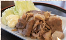
猪肉ガーリックステーキ ¥840

営業日にいつでも食べられるのがうれしい。 また、隠れた人気商品「猪肉ガーリックステー キ」は、ビー ルに合うの はもちろん、 夏バテ防止 のスタミナメ ニューとして どうぞ。