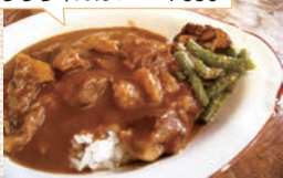
ししちゃんカレー ¥650