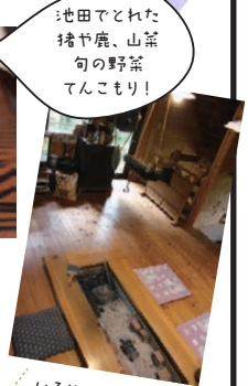
池田でとれた猪や鹿、山菜旬の野菜 てもこもり! いろいろを回んでのランチが新鮮!