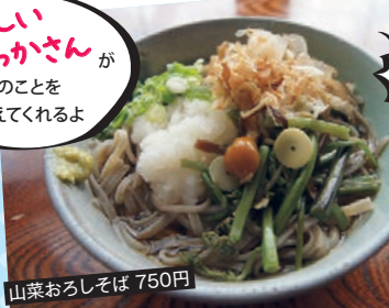
山菜おろしそば 750円