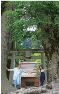
樹齢数百年の大きな杉と樺の奥に白山神社が。